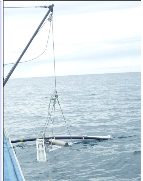
浅海域電磁探査のようす

海に囲まれた日本では、浅海域を含む沿岸域が広く分布しております。ところが、上記の理由でこれまで沿岸域での電磁法調査が十分行われてきませんでした。本装置を用いることで、沿岸域の比抵抗構造を取得することが可能となりました。